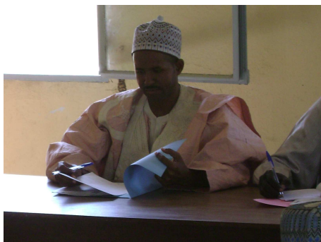
PLANCHE 1 : CAMPAGNE DE MARKETING SOCIAL A MAKARY EN IMAGES